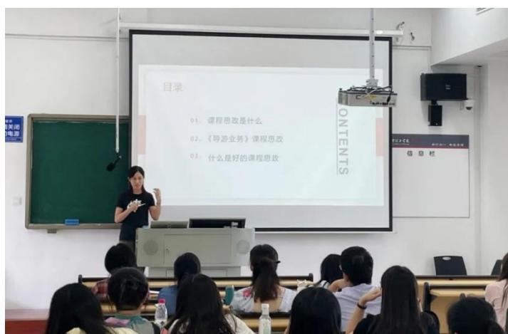
图 4 为商学院教师在开展课程思政研讨会

各二级学院积极组织举办课程思政元素挖掘讨论会，对《高等学校课程思政建设指导纲要》进行详细解读，从不同学科和专业讲解了如何构建科学合理的课程思政教学体系，引导教师深化认识，积极扛起课程思政建设责任，着力提升人才培养能力，全面形成广泛开展课程思政建设的良好氛围。