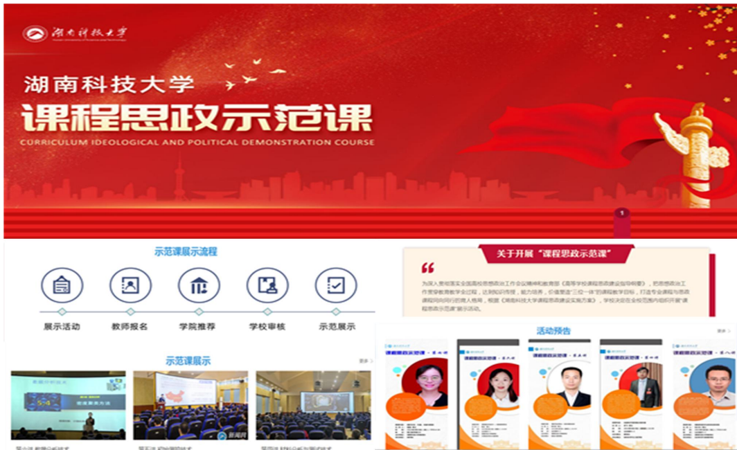
图1 “课程思政示范课”示范平台