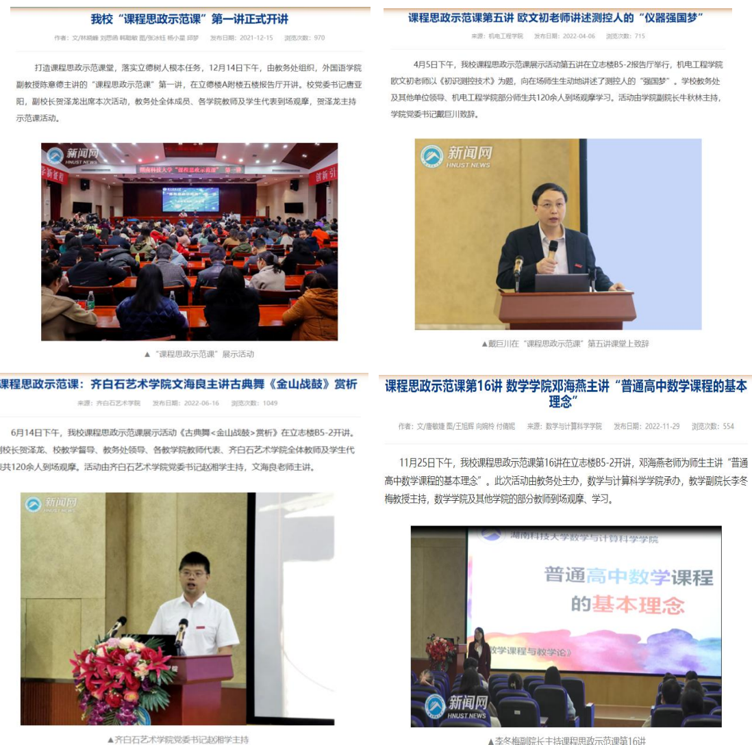
图2 湖南科技大学课程思政示范课新闻稿（示例）