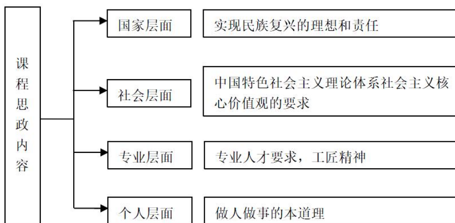
图 1 四个层面的课程思政内容

《工程机械底盘构造》课程是一门理论与实践环节紧密结合的课程，思政建设有难度，但是也有优势，优势就是以自然科学为载体加强思政教育，增加了可信度。教学团队积极开展“课程思政”研究，对工程机械构造课程设计了四个层面的课程思政内容如图 1 所示：